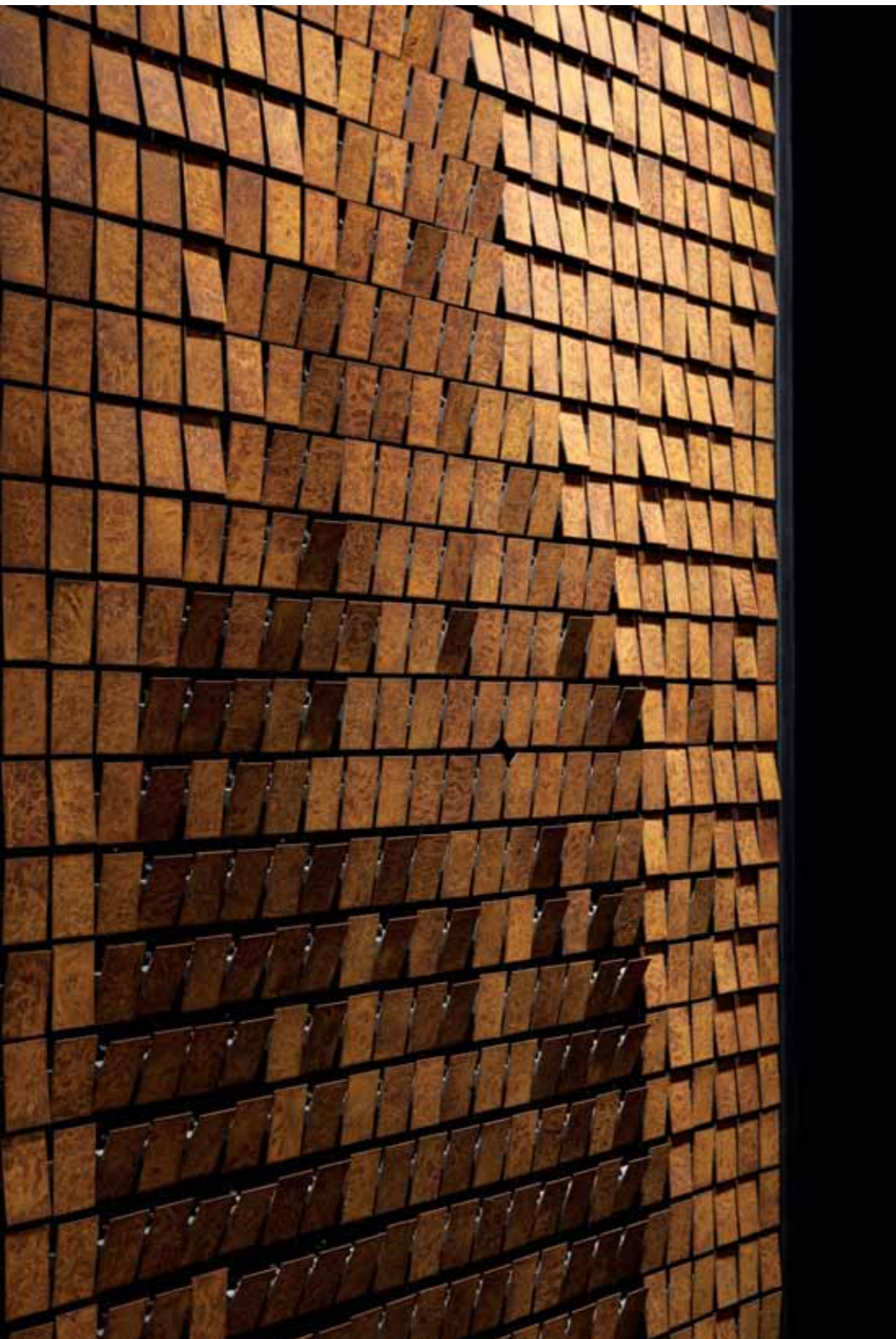
A LA IZDA.: 'RUST MIRROR' (2010). EN PÁGINA SIGUIENTE. A LA IZDA.: 'SNOW MIRROR' (2006). A LA DCHA.: 'CIRCLES MIRROR' (2006).